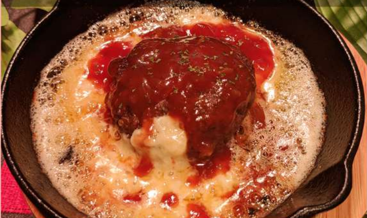
チーズがまるでマグマみたいにグツグツに！カメラのご準備を チーズマグマハンバーグ ダブル 1,300yen シングル 800yen