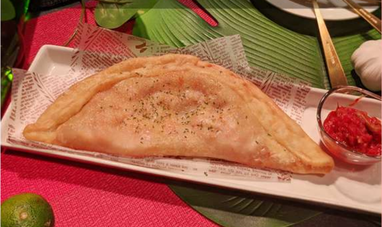
ピザを揚げて食べる！？新時代なピザの食べ方。 揚げピザ トマトチーズ/グラタン 680yen