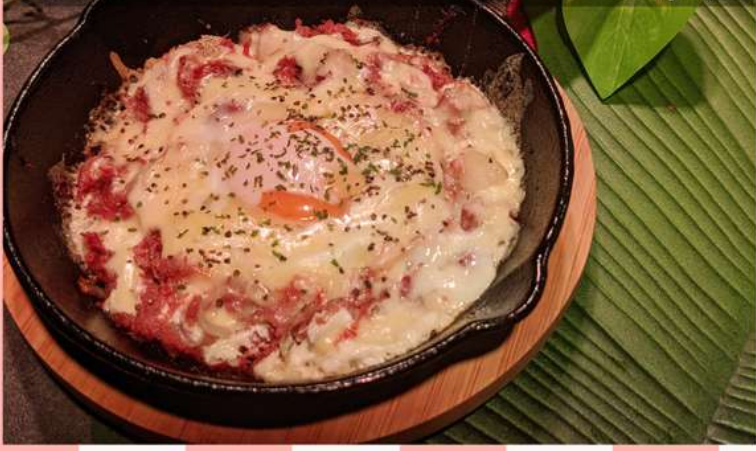
コーンビーフとチーズを使った旨味の暴力料理！SNS映えだ！ コーンビーフエッグチーズステーキ 800yen