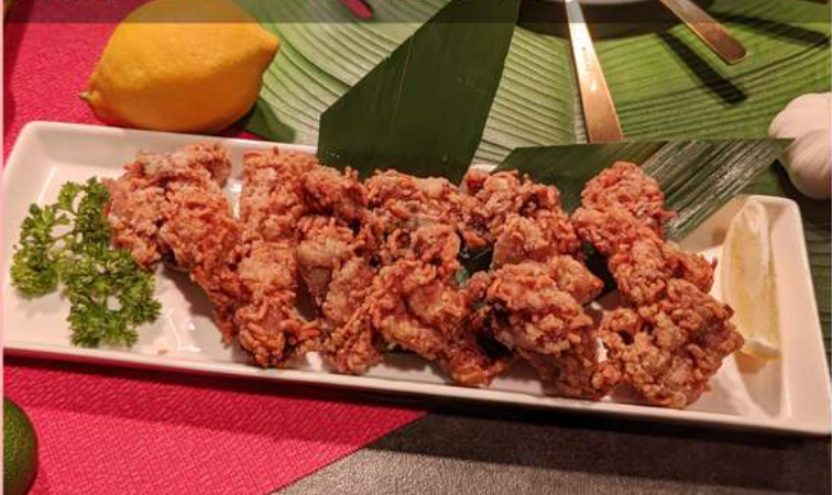
ベビースターを使って奇跡の食感で美味しさ抜群！ 至高のベビー唐揚げ 550yen