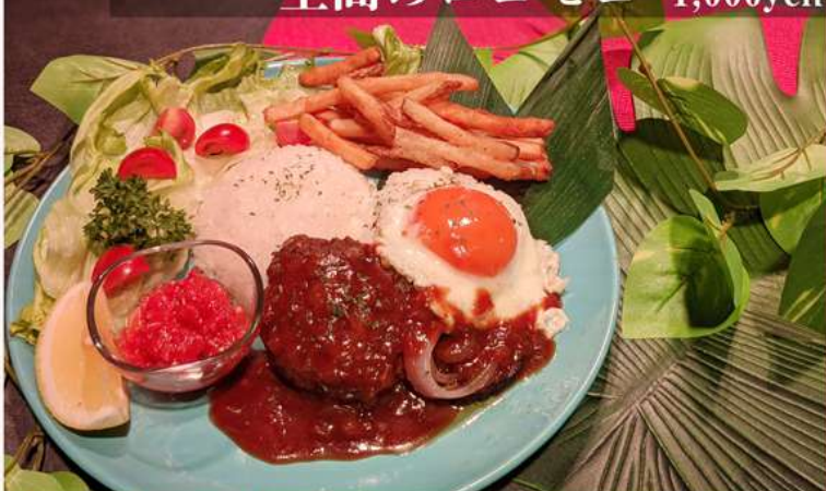
ジューシーな宮崎和牛のハンバーグに、癖になるソースの ハワイアン人気定番メニュー！ 至高のロコモコ 1,000yen